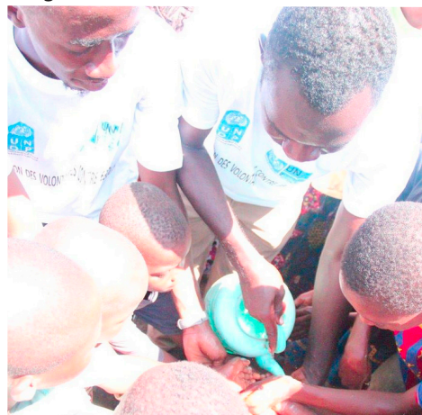
Jóvenes locales ayudan en los barrios de Conakry (Guinea) demostrando prácticas higiénicas.

El PNUD prestará apoyo a la capacitación de los movilizados de la comunidad, los dirigentes juveniles, los maestros, los líderes religiosos sobre actividades de divulgación y de transmisión de mensajes acerca de la atención y la prevención del Ébola y contribuirá a la promoción del comportamiento responsable, la disipación de rumores y la reducción del estigma.