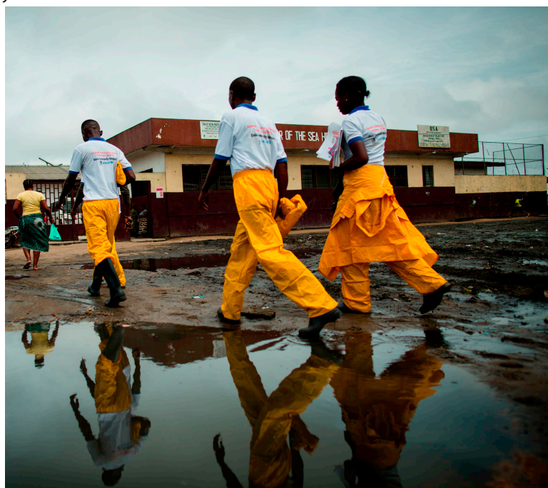
Trabajadores de respuesta al Ébola se dirigen al trabajo en Monrovia (Liberia).

Los efectos del virus se sentirán mucho después de que este se haya controlado, y posiblemente afectarán a millones de las personas más pobres y vulnerables, y en forma desproporcionada a mujeres y jóvenes.